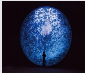
ワグ ドリーム館(加茂水族館)