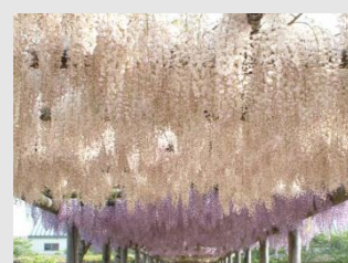
藤のはなまつり(5月上旬)中止になる場合がございます