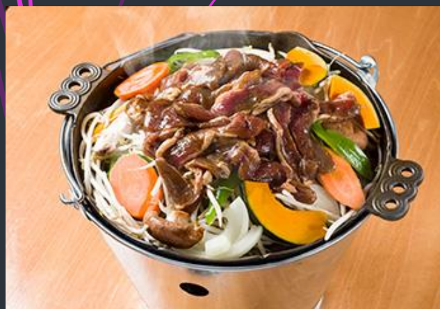
とねっこジンギスカン