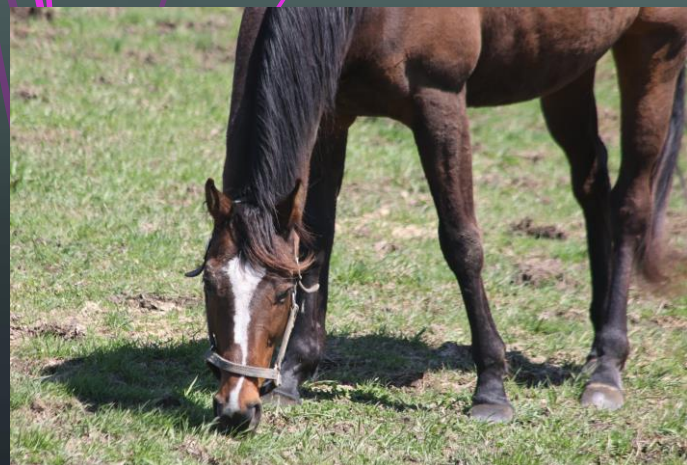
タニノギムレット