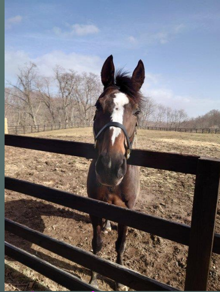
オジュウチョウサン