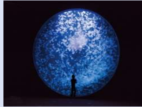
ワグドリーム館(加茂水族館)