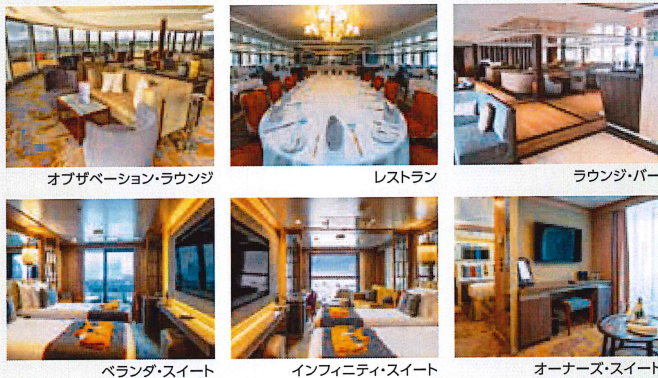
オブザベーション・ラウンジ

全客室の72%がバルコニー付で、南極に就航しているどの客船よりも広い25㎡以上の客室。また、ゴム長靴や防寒具を収納できるロッカーが備わったマッドルームも完備し、快適な南極旅行をお楽しみいただけます。世界最高級レベルの探検客船で太古の大自然と野生生物の楽園・南極を満喫いただけます。