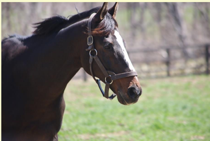
オジュウチョウサン（Yogiboヴェルサイユリゾートファーム）