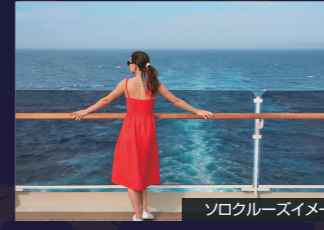
ソロクルーズイメージ

人気のダンスイベント。 広々としたクイーンズ・ルームを開放したボールルームで、生演奏をバックに華麗なダンスをお楽しみください。ダンスパートナーが必要な時はダンスホストがお相手させていただきます。初心者でも参加できるダンスの講座クラスはいつも人気です。