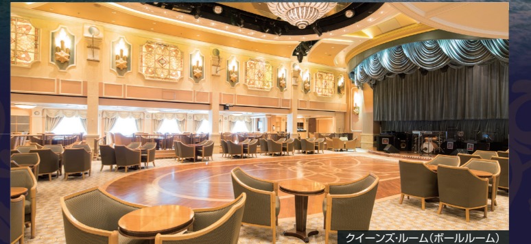
クイーンズ・ルーム(ボールルーム)