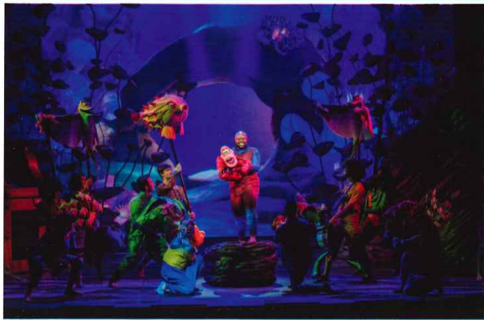
ディズニー・ウィッシュ号 船上ミュージカル「リトル・マーメイド」