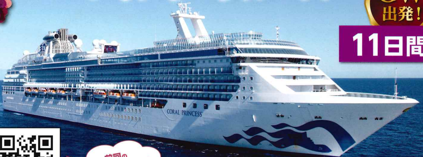
コーラル・プリンセス